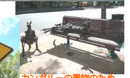
カンガルーの置物のため、一人しか座れないベンチ...