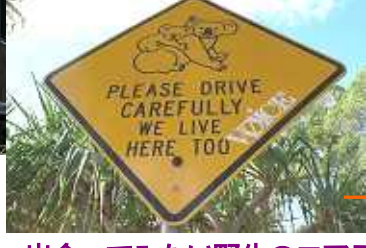
出会ってみたい野生のコアラ！！