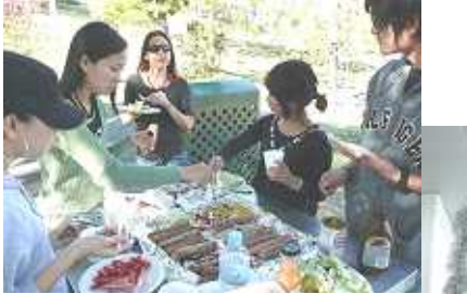
オージーといえばバービー(BBQ)！放課後はバーベキューへ！