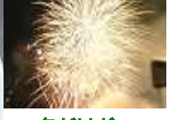
冬だけど花火大会~！