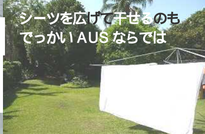
シーツを広げて干せるのも でっかいAUS ならではの