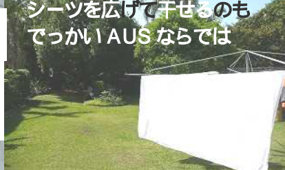
シーツを広げて干せるのもでっかいAUSならではの