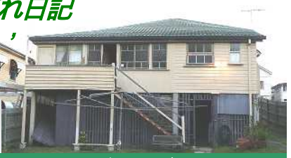
クイーンズランダーズという2階に住む伝統的な家です