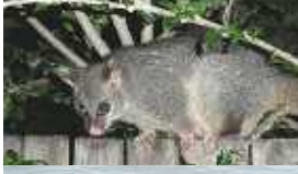
野良ポッサムがたくさんいます