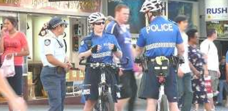
自転車はヘルメット着用がルールです。日本のように子どもをのせて走ると驚かれます。