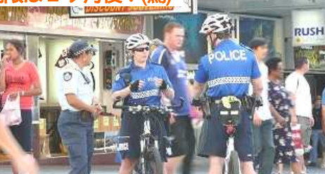
自転車はヘルメット着用がルールです。日本 のように子どもをのせて走ると驚かれます。