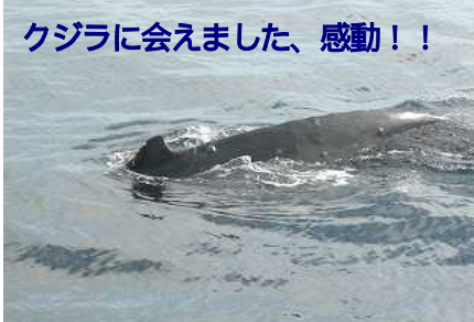
クジラに会えました、感動！！