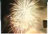
冬だけど 花火大会~！