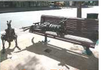
カンガルーの置物のため、 一人しか座れないベンチ...