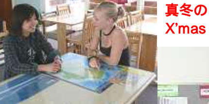
真冬の 7 月には X'mas も祝います