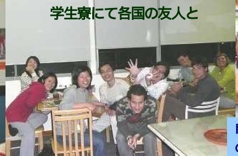
学生寮にて各国の友人と