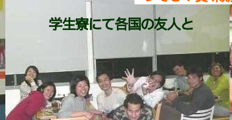
学生寮にて各国の友人と