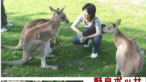
人口よりカンガルーの方が多いのを納得...