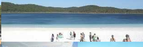
なが~いゴールドコースト