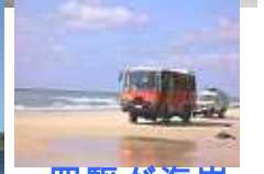
四駆が海岸を快走！