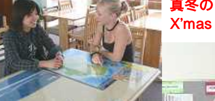
真冬の7月にはX'masも祝います