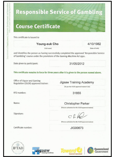
ギャンブル取り扱い資格 R S G