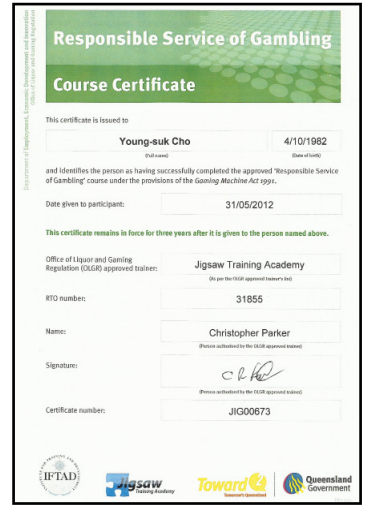
ギャンブル取り扱い資格 R S G