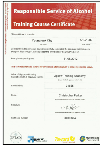
アルコール取り扱い資格 R S A